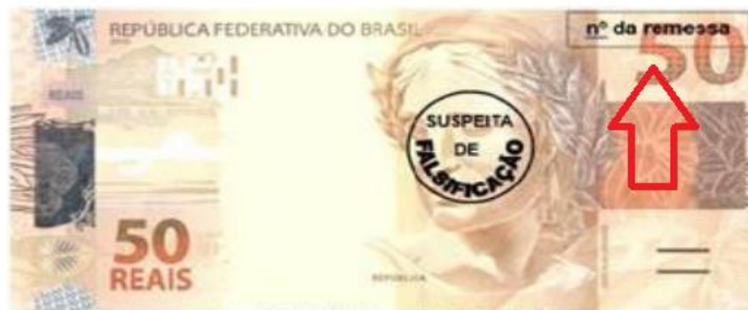
Exemplar de cédula da segunda família do Real